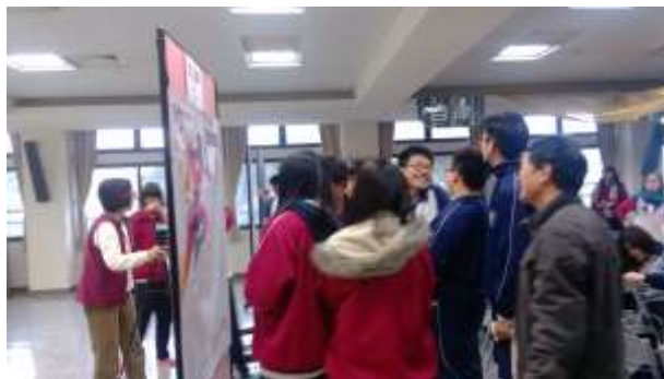
祝福禮之同學留言時間(上)